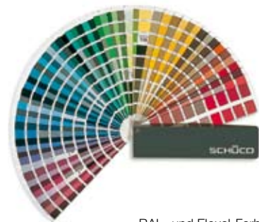
RAL- und Eloxal-Farben