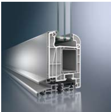
Schnitt Haustür Schüco SI 82