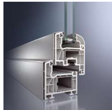
Schnitt Fenster Schüco CT 70